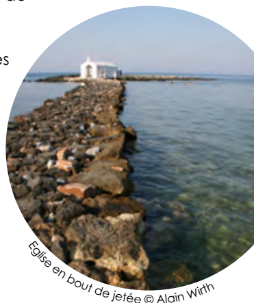
Eglise en bout de jetée