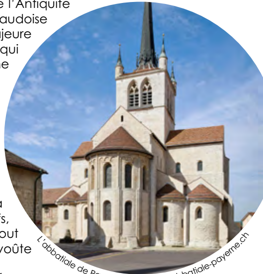
L'abbatiale de Payerne rénovée

Concerts sur les orgues au fil de la journée.